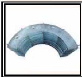
Svěry d63 – 180 mm