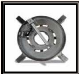
Nástavec pro příruby